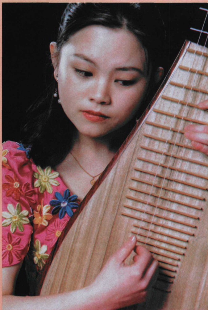
著名琵琶大师刘德海的《天鹅》 在董楠手指下飞翔