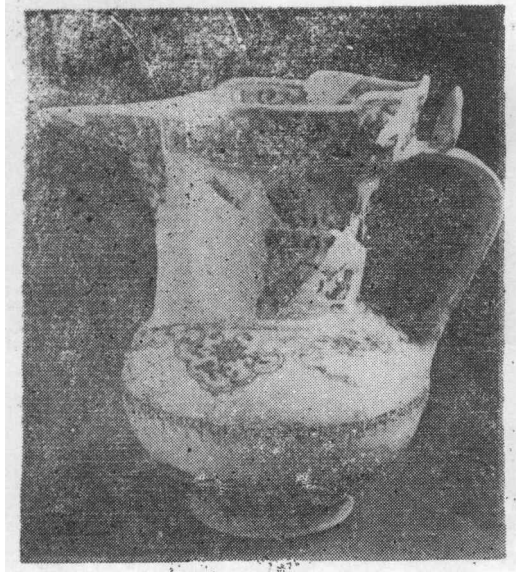
景德镇青花僧帽壶